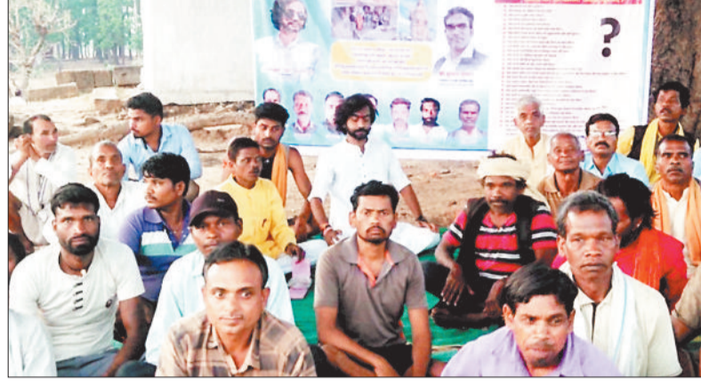
सत्याग्रह करते ग्रामीण।