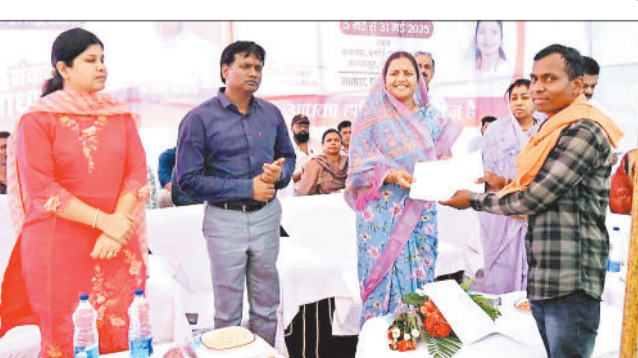
शिविर में ग्रामीण से ज्ञापन लेती मंत्री लक्ष्मी राजवाड़े।

किया जा रहा है। उन्होंने उपस्थित अधिकारियों को निर्देशित किया कि राजस्व संबंधी सभी प्रकरणों का समाधान बेहतर और शत-प्रतिशत रूप से किया जाए जिससे आमजन को त्वरित लाभ मिल सके। कैबिनेट मंत्री द्वारा शिविर में लोगों से प्राप्त आवेदनों के आधार पर बी-वन दस्तावेज और राशनकार्ड का वितरण भी किया गया। कैबिनेट मंत्री लक्ष्मी राजवाड़े ने सुरजपुर कलेक्टर से पीएचई विभाग के कार्य में विशेष निगरानी रखते हुए आमजन को भीषण गर्मी में होने वाले पेयजल की किल्लत से निजात दिलाए जाने के निर्देश दिए हैं। उन्होंने कहा कि शासन की सभी योजनाओं का लाभ समाज के अंतिम व्यक्ति तक पहुंचाने की