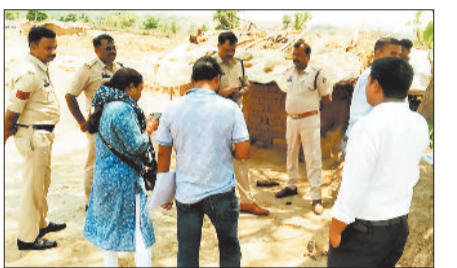
ईट भट्टे में कार्रवाई करती टीम।