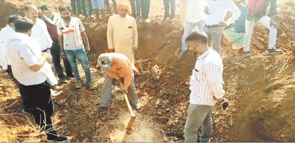
घंटिया निर्माण को उखड़ा कर देखते विधायक।

सड़क की जगह नए सिरे से निर्माण कार्य कराने के निर्देश दिए। वहीं ग्रामीणों ने आजादी के बाद पहली बार बन रही सड़क में लीपापोती करने वाले अधिकारी एवं ठेकेदार के विरुद्ध कार्रवाई की मांग की है। उन्होंने घंटिया निर्माण पर सवाल खड़े करते हुए अधिकारियों से जवाब लंबाब किया। संबंधित अधिकारी विधायक के सवाल का जवाब देने के बजाए बगले झांकने लगे। हालांकि बाद में अधिकारियों ने सड़क निर्माण कार्य में लगे मिश्री एवं मजदूरों पर इसका ठीकरा फोड़ते हुए माना कि सड़क निर्माण कार्य में लापरवाही बरती गई है। अधिकारियों का ये जवाब सुन विधायक ने उन्हें जमकर खरी खोटी सुनाई और घंटिया